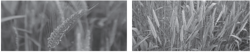
Рис. 4. Перспективные селекционные линии ярового тритикале 1548-19 (Укро × ДальГАУ 1) (слева) и 1546 (Укро × Лана)