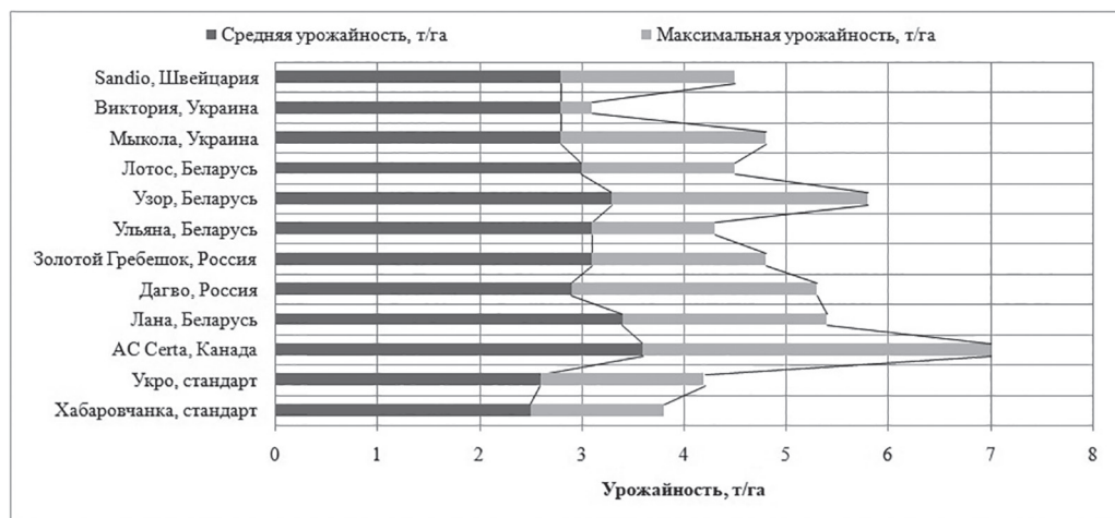
Рис. 2. Урожайность продуктивных сортообразцов ярового тритикале

Среднесортовой показатель фактически убранный урожай ярового тритикале за пять лет экологического изучения составил 2,4 т/га. Благоприятные условия для реализации продуктивного потенциала и урожайных качеств сортообразцов ярового тритикале сложились в 2017 и 2019 гг., при этом амплитуда величины урожайности в условиях региона у некоторых образцов ярового тритикале отличается от среднего значения в 2 раза как в положительную, так и в отрицательную стороны. Максимальная урожайность отмечена у позже поступивших в коллекцию сортов Wanad – 9,7 т/га (2017 г.) и Ярик – 9,2 ц/га (2019 г.), что свидетельствует о высоких потенциальных возможностях образцов ярового тритикале в данной экологической зоне. В среднем за годы исследований наибольшая урожайность отмечена у сортообразцов ACCerta, Лана, Дагво, Золотой Гребешок, Ульяна, Узор, Лотос, Мыкола, Виктория, Sandio – превышение над стандартным сортом тритикале Укро составило 1,5–7,8 ц/га, над стандартным сортом яровой пшеницы Хабаровчанка – 0,2–0,9 т/га (рис. 2).