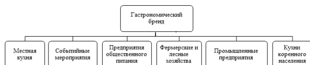
Рисунок 2 – Элементы гастрономического бренда *Составлено автором

Согласно рисунку элементами гастрономического бренда являются местная кухня, событийные мероприятия, предприятия общественного питания, фермерские и лесные хозяйства, промышленные предприятия, кухни коренного населения