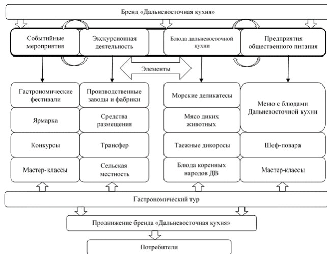
Рисунок 4 – Концепция туристского гастрономического бренда «Дальневосточная кухня»

Следует оговориться, что для улучшения сбалансированности питания необходимо включать в рацион функциональные и обогащенные продукты, включающие достаточное количество аминокислот, витаминов и минеральных веществ, которые в достаточном количестве содержатся в местной сырьевой базе (продуктах моря) [25].