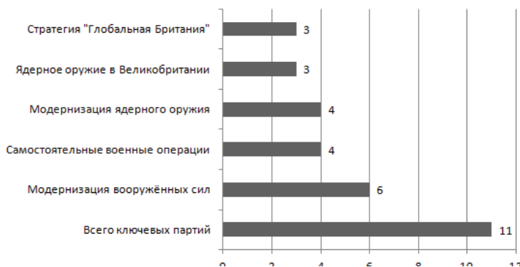
Рис. 2. Сравнительный анализ поддержки ключевыми партиями стратегий правительства в области безопасности и обороны