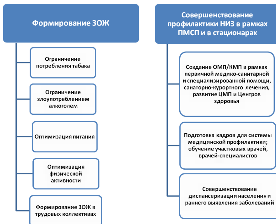
Рис. 2. Основное содержание комплексных целевых программ по профилактике НИЗ на уровне субъектов РФ

Как правило, формирование ЗОЖ включает такие мероприятия как ограничение потребления табака, ограничение злоупотреблением алкоголем, оптимизацию питания и физической активности, формирование ЗОЖ в трудовых коллективах.