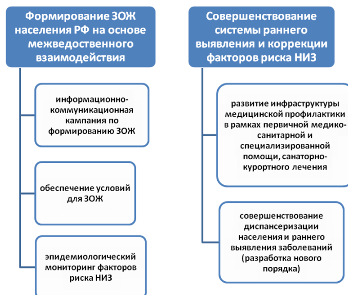
Рис. 1. Структура мероприятий по формированию ЗОЖ и профилактике НИЗ

обеспечения условий для ЗОЖ и эпидемиологического мониторинга факторов риска НИЗ (рис. 1).