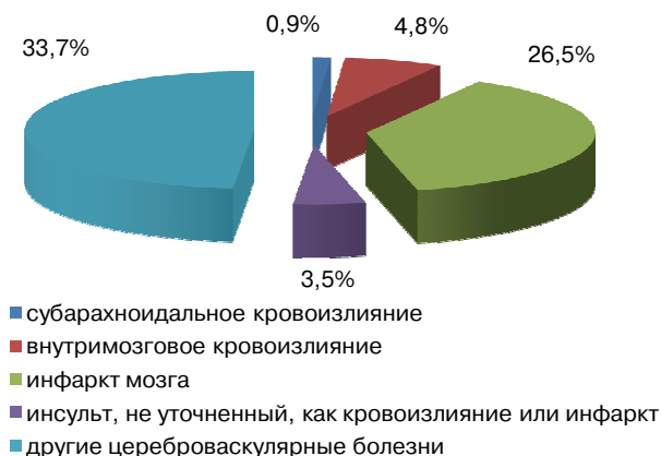
Рис. 2. Структура первичной заболеваемости взрослого населения Оренбургской области цереброваскулярными болезнями (2013 г.)

Анализ динамики показателей первичной заболеваемости взрослого населения Оренбургской области ЦВБ за последние пять лет (период с 2009 по 2013 г.) выявил рост показателя с 6,8‰ до 8,5‰. При этом колебания данного показателя привели к его выраженному повышению до 9,1‰ в 2012 г. с последующим снижением, темп которого составил 6,6%.